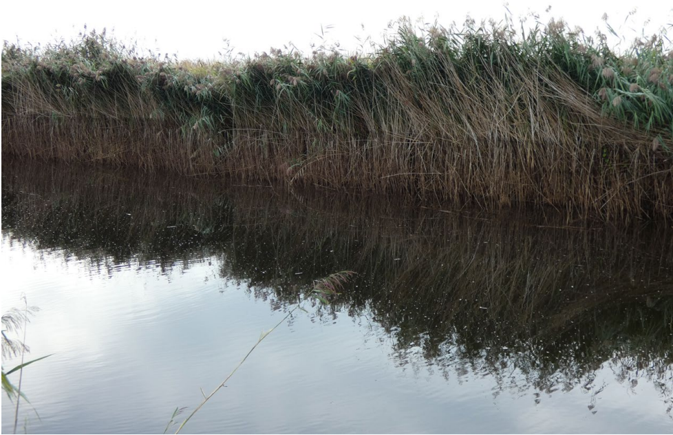
Fot. 3. Trzciny nad brzegiem kanału we wrześniu 2022 roku – pompa melioracyjna uruchomiona. Widoczny ślad do ok. 1 m po stagnującej wodzie.