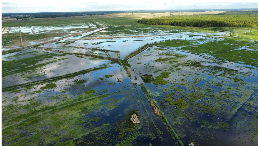
Fot. 1. Widok na Polder Czarnociński w lipcu 2022 roku – awaria pompy melioracyjnej.

Photo 1. View of the Czarnociński Polder in July 2022 – drainage pump failure.