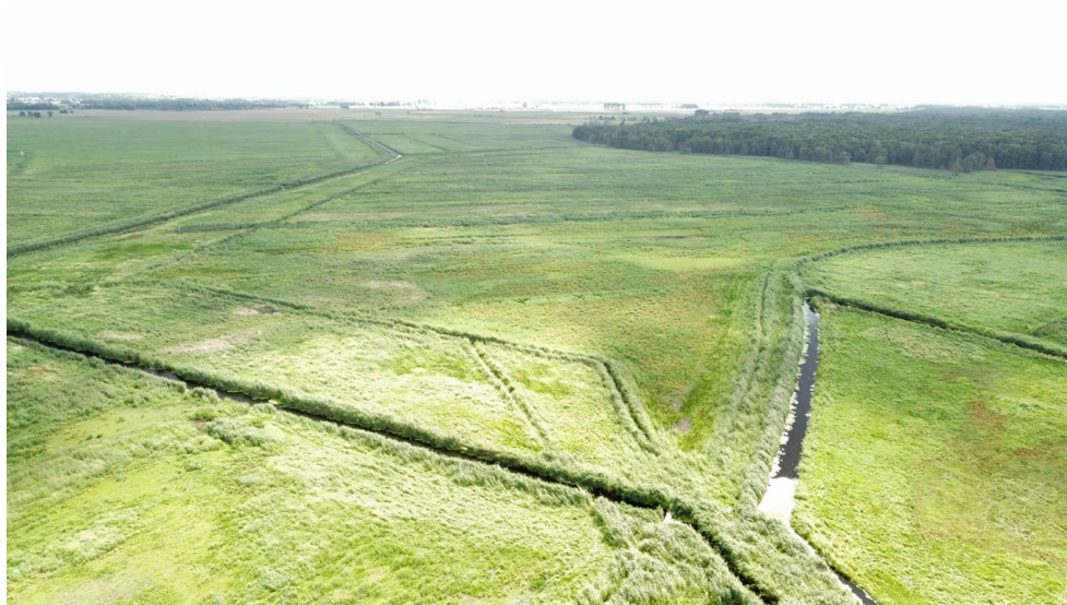
Fot. 2. Widok na Polder Czarnociński w lipcu 2023 roku – pompa melioracyjna sprawna.

Photo 1. View of the Czarnociński Polder in July 2022 – drainage pump failure.